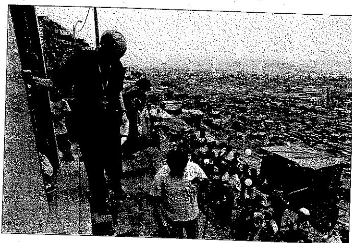
Un obispo se adentra en territorios peruanos de pobreza extrema.

Este año deseo proponer algunas reflexiones a la luz de un breve texto bíblico tomado de la Carta a los Hebreos: «Fijémonos los unos en los otros para estímulo de la caridad y las buenas obras» (10, 24). Esta frase forma parte de una perícopa en la que el escritor sagrado exhorta a confiar en Jesucristo como sumo sacerdote, que nos obtuvo el perdón y el acceso a Dios. El fruto de acoger a Cristo es una vida que se despliega según las tres virtudes teologales: se trata de acercarse al Señor «con corazón sincero y llenos de fe» (v. 22), de mantenernos firmes «en la esperanza que profesamos» (v. 23), con una atención constante para realizar junto con los hermanos «la caridad y las buenas obras» (v. 24). Asimismo, se afirma que para sostener esta conducta evangélica es importante participar en los encuentros litúrgicos y de oración de la comunidad, mirando a la meta escatológica: la comunión plena